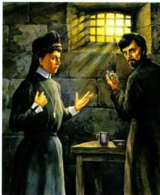
И. Каляев и великая княгиня Елизавета Фёдоровна. Современный рисунок.

Но все было напрасно. Оставив Евангелие и маленькую иконку, она ушла.» 3)