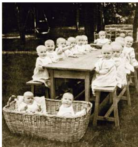
Дети в приюте Комитета великой княгини Елизаветы Федоровны.

В притоне поднялся шум. Великую Княгиню убеждали, что избранный ею непременно украдѐт мешок.