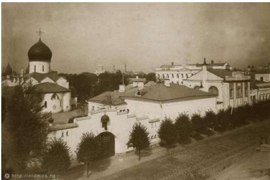
Марфо-Мариинская обитель. 1913 г.

9 апреля 1910 года Великая княгиня Елизавета Федоровна Романова принимает монашеский постриг.