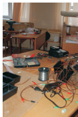
не мусор, а оборудование