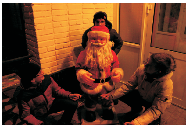
Санта и эльфы