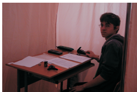
я оглянулся посмотреть...