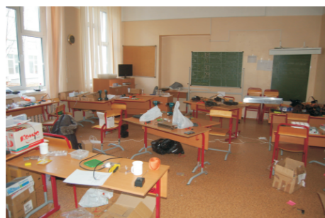
гений царит над хаосом