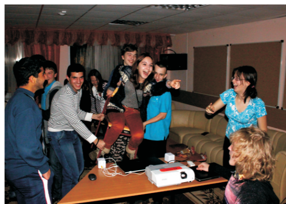
земля прямо по курсу