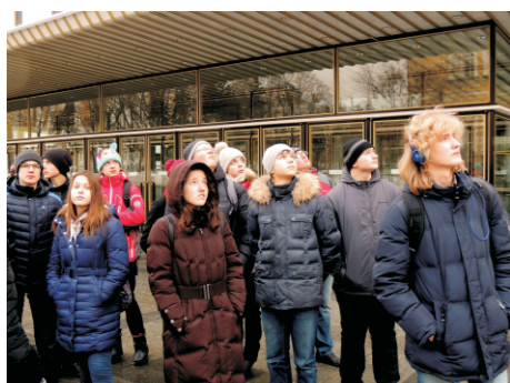
взгляд в будущее