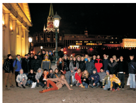
за нами Москва!